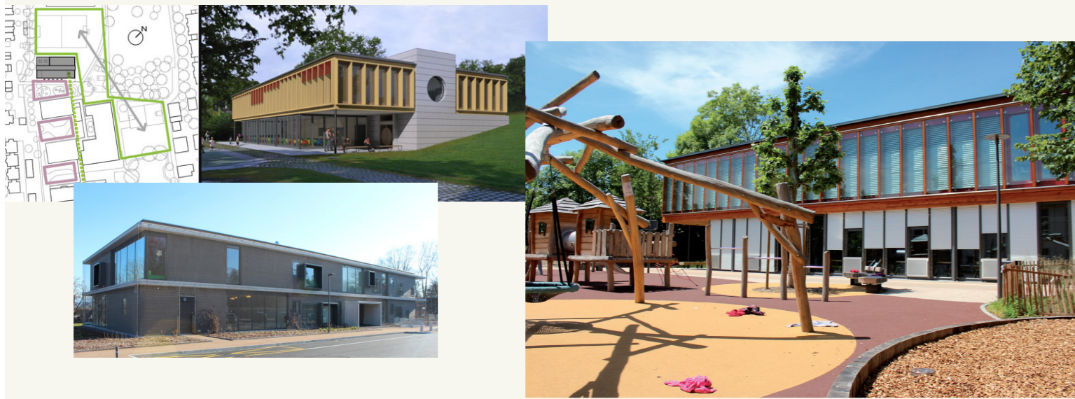
Avec ces superbes réalisations, l'enfance et la petite enfance sont couvertes à Bellevue ! Mais qu'en est-il de la jeunesse ?

Ces dernières années, BdA a participé activement à la mise en place et à la gestion de structures pour la petite enfance (crèche, parascolaire, ...). Pour cette législature, BdA souhaiterait s'intéresser à l'occupation de nos adolescents et pré-adolescents (de 12-17 ans) ainsi qu'à diversifier l'offre de garde durant les vacances pour les plus jeunes (6-11 ans).